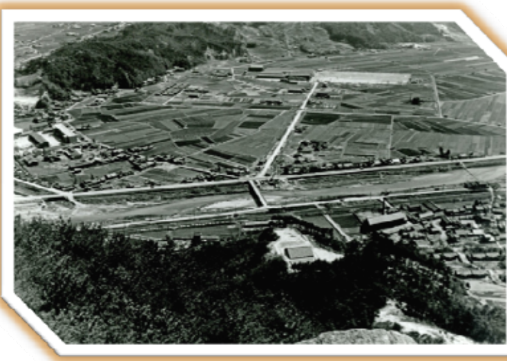
日浦山から海田中学校付近を見た眺め(昭和20年頃)