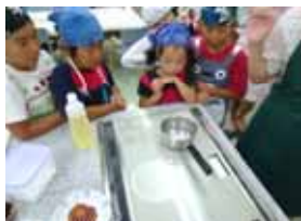
あっという間に水が沸くのを見て親子でビックリ!