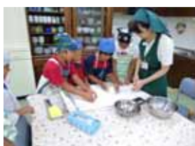
ピザの生地をこねています。