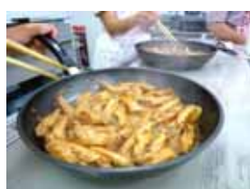
ピザソース+お醤油+マレード!? どんな味になるのかな?