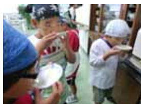
味見の「おかわり」は最高です!

節電・省エネでこの美味しさ! たっぷりのボリューム! ピザのおかわりもありました。 電化シュミレーションやIHのお手入れ方法まで 美味しく楽しく勉強できました。