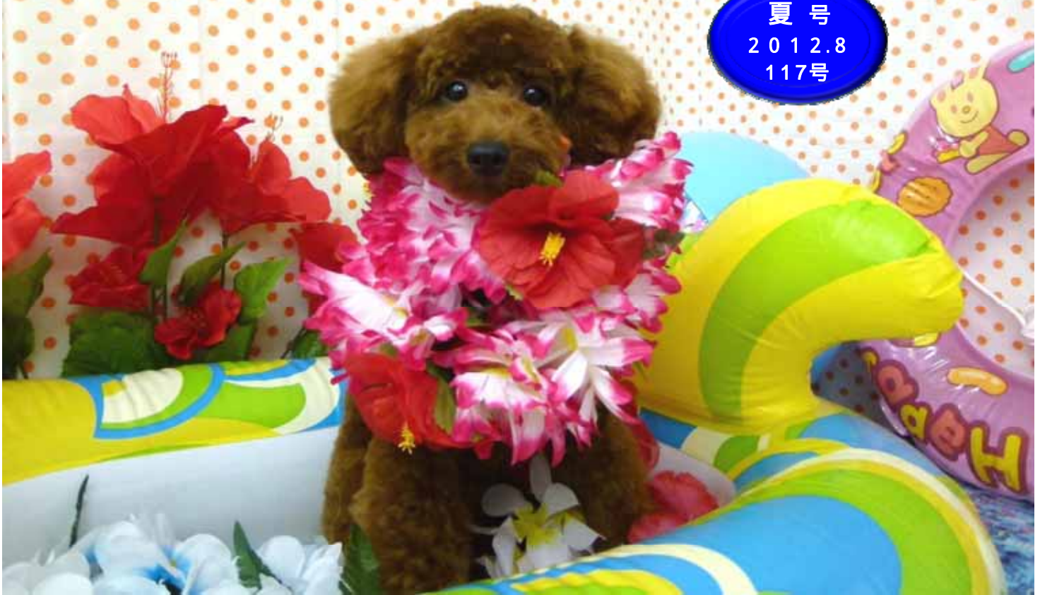
トロピカルワイド君