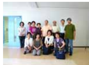
セミナー受講生の皆様と