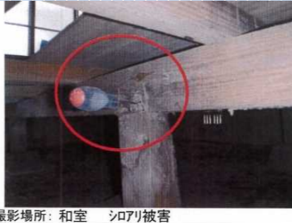
撮影場所: 和室 シロアリ被害