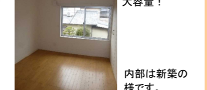
内部は新築の様です。