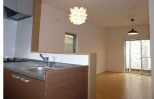
LDKが一行に見渡せます。