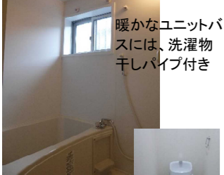
ウォシュレット付節水洋式便器