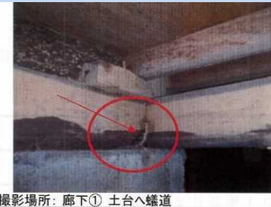
撮影場所: 廊下① 土台へ蟻道