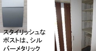
スタイリッシュなポストは、シルバーマトリック