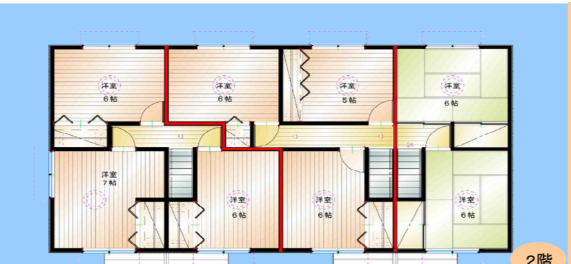
2階 Ctype 入居済 床面積 82.80㎡ Btype 入居済 床面積 76.18㎡ Atype 入居済 床面積 52.98㎡