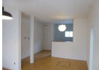
賃貸住宅で対面キッチン。家族の会話もふくらみます。