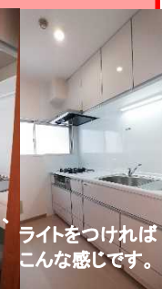
ライトをつければこんな感じです。