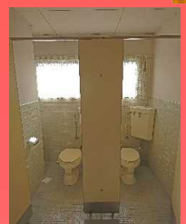
以前、支所として使われていたため、洋便器が2つありました