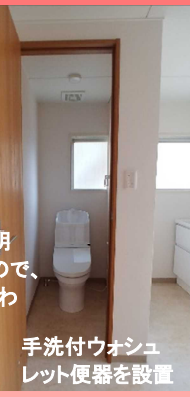
手洗い付ウォシュレット便器を設置