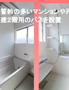
管約の多いマンションや戸建2階用のバスを設置