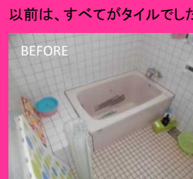
以前は、すべてがタイルでした