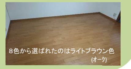
8色から選ばれたのはライトブラウン色(オーク)