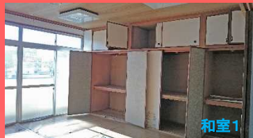
長い間、空き部屋だったため、襖も畳も傷んでました