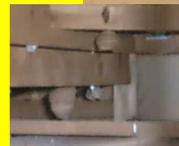
こちらのお宅の天井裏には、縦15cmくらいの巣が5～6個作られていました。