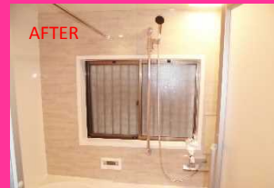
お掃除ラクラクホーローパネルに取り換えました

【トイレ】 手洗い付ウォシュレット便座、二連紙巻器を設置。天井・壁クロスを取替ました。天井は空模様クロスをえらばれたのですが、開放感がありますよね。