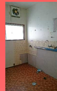
以前はここで料理を作っていたそうです