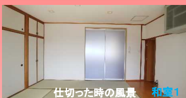
仕切った時の風景