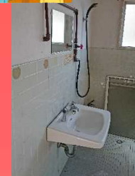
広い洗面所には、洗面台とシャワーだけ