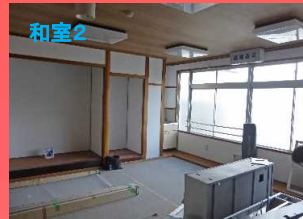
畳を取外され、クッションシートが敷いてあり、ホールのようにでした