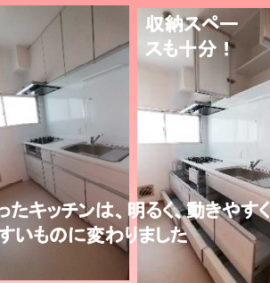
収納スペースも十分！