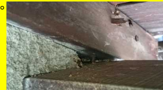
小さな隙間から入って巣作りします。

巣作りは8月～9月がピークだそうです。撤去は危険ですので、防護服を着て作業します。統計的にみると40代男性が刺されやすいそうです。