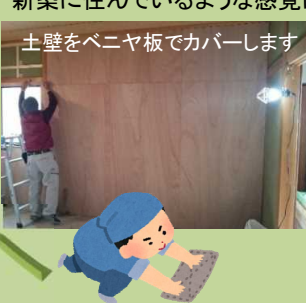
土壁をベニヤ板でカバーします

蜂の巣撤去シーズンが終わり、次に多かった依頼は、『和室を洋室に変更したい』というものでした。各家ごと、工事する理由は違いますが、これからは和室よりも洋室の方が、生活しやすいのかもしれませんが、ただ、和室を洋室に変えるので、床を変えるだけでは済みません。部屋の雰囲気を考えれば、皆さん壁も一緒に取りかえられます。以前とは全く違う部屋に様変わりし、慣れるまでよその家にいるような感じになります。新築に住んでいるような感覚になりそうですね。